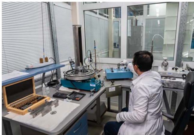
Ремонт и градуировка пневматических калибраторов давления Метран-500 Воздух

Градуировка выполняется, если погрешность калибратора или задатчика превышает допускаемые пределы.