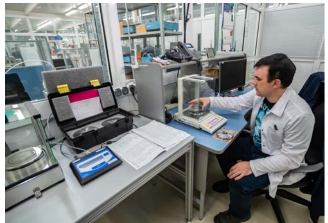
Подгонка массы грузов на эталонных весах