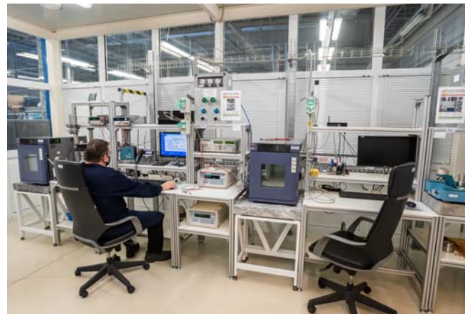
Калибровка портативных калибраторов давления и эталонных модулей давления Метран

Градуировка выполняется, если основная погрешность калибратора превышает допускаемые пределы.