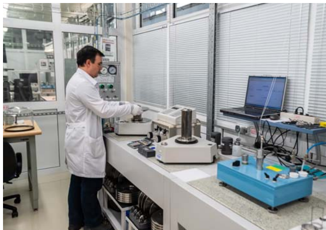
Работы по калибровке с использованием прецизионного грузопоршневого калибратора давления PG7601

Наши специалисты проводят консультации по подбору метрологического оборудования, производят монтаж и наладку стандов, их дальнейшую модернизацию и комплектацию новыми эталонами, а также осуществляют разработку программного обеспечения.